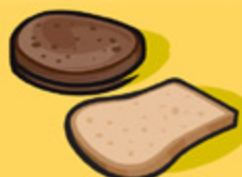
Pain 1 tranche (35 g)