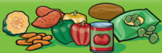
Légumes frais, surgelés ou en conserve 125 mL (½ tasse)