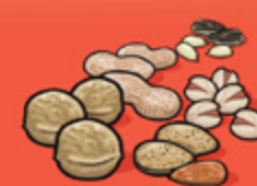
Noix et graines écalées 60 mL (¼ tasse)