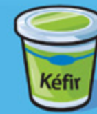
Kéfir 175 g (¾ tasse)