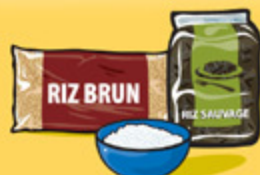
Riz, boulgour ou quinoa, cuit 125 mL (½ tasse)