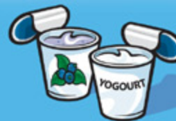
Yogourt 175 g (¾ tasse)