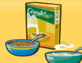
Céréales Froides : 30 g Chaudes : 175 mL (¾ tasse)