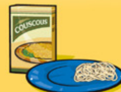
Pâtes alimentaires ou couscous, cuits 125 mL (½ tasse)