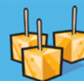
Fromage 50 g (1 ½ oz)