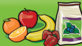
Fruits frais, surgelés ou en conserve 1 fruit ou 125 mL (½ tasse)