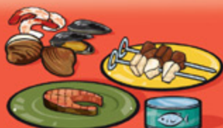
Poissons, fruits de mer, volailles et viandes maigres, cuits 75 g (2 ½ oz)/125 mL (½ tasse)