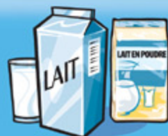
Lait ou lait en poudre (reconstitué) 250 mL (1 tasse)