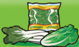
Légumes feuillus Cuits : 125 mL (½ tasse) Crus : 250 mL (1 tasse)