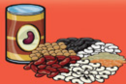
Légumineuses cuites 175 mL (¾ tasse)