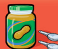
Beurre d'arachide ou de noix 30 mL (2 c. à table)